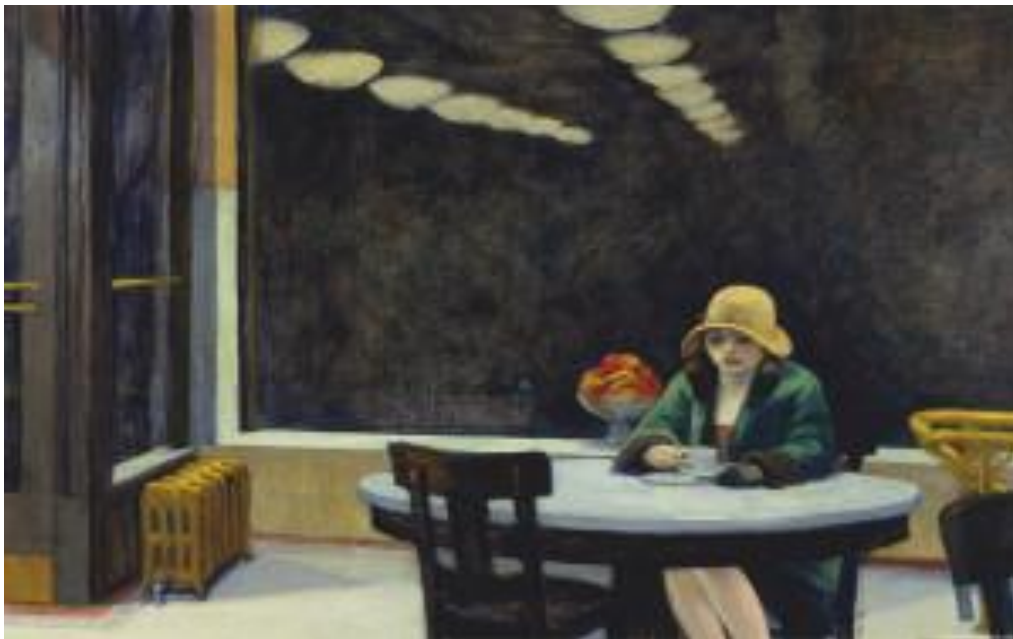
Edward Hopper, Automat , 1927